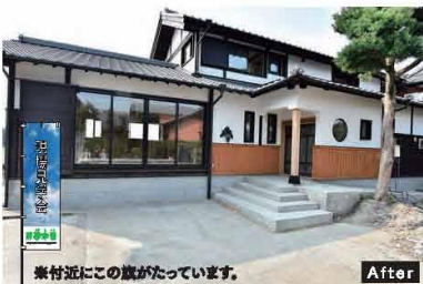
▲佐賀県産の杉・檜をふんだんに使った古民家リノベーション

「日本では高度経済成長以降、プレハブ住宅やツーバイフォーや木造でもプレカットで加工し外材を多用する住宅が増えました。石油系塗料や接着剤、新建材、ビニルクロスを使用した住宅は時としてシックハウス症候群や化学物質過敏症を引き起こし、家の寿命も30年から40年と非常に短いです。私が育った鹿島市三河内の浅浦地区は林業の恩恵を受けて、約1500戸の半数近くが100年を超える古民家です。近く、山から100年たった木を伐り出し、子や孫の代まで残る家造る。 植林して、子や孫の代に家を造る。そのため子育てという考え方のもとに残ってきました。また改築で解体してもその多くがリサイクル