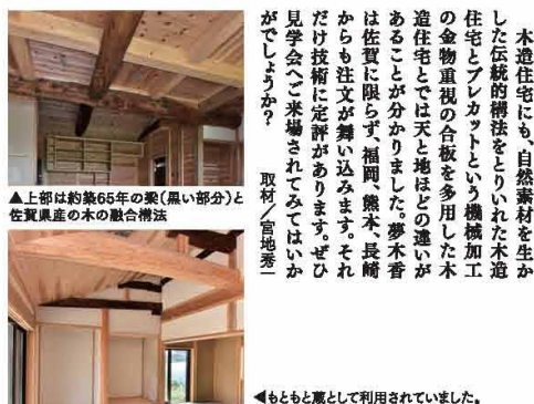
▲上部は約築65年の梁(黒い部分)と佐賀県産の木の融合構法

ほしい、木と土壁がもつ調湿作用で、本物の自然素材のにおいで、木の香りと漆喰や土のにおいで、肌によれるこぢみさを、無垢の床板を裸足で歩いてください。キッチンも洗面も浴室も無垢材の手造りです。 見て楽しんでください、伝統的な木組みと、骨太の木組みが持つ安心感。 耳を澄ましてください、響かない音を、木や土は音を吸収します。 適度な反響、なぜなら多くの楽器は木製です。 今、まわりの環境は、無機質なものの人工的な物に変わりつつあります。心と体の健康を育む住まいづくり。せめて家の中だけでも、こぢみい空間がほしいものです。 子どもたちに自然のハーモニーを聴かせてあげたいものです。