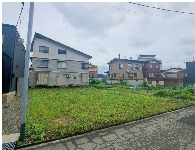
前面道路ブル除雪