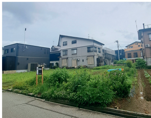
前面道路ブル除雪 / 敷地一部に北越急行(株)の地上権が有り、建築制限が有ります。