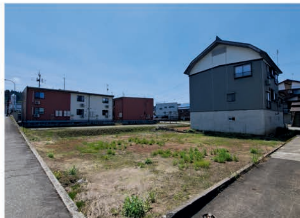
前面道路ブル除雪 / 水道は負担金の他に引込工事費が必要