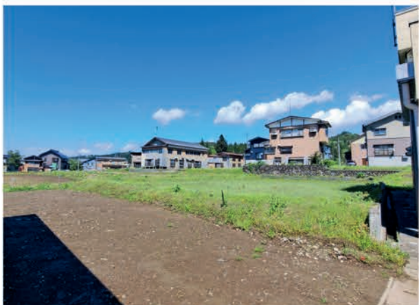
前面道路消雪パイプ / 東小学校まで徒歩4分