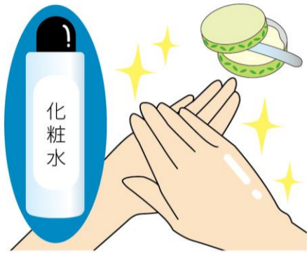
お休み前は、ハンドクリームの前に化粧水などをつけてから塗ると、保湿力がアップします♪

美しい手を保つためには、保湿が大切。手洗いをした後はまめにハンドクリームをつけることをおすすめします。ハンドクリームの説明書きにある量を、手のひらをすり合わせて温めると伸びが良くなります。手の甲をおさえながら全体に塗りまします。指と指の間は両手を組んで上下に滑らせるようにして塗り、親指は意外と完全に塗れていないこともあるので、優しく塗りましょう。爪も親指や人差し指で軽くすり込むようにします。