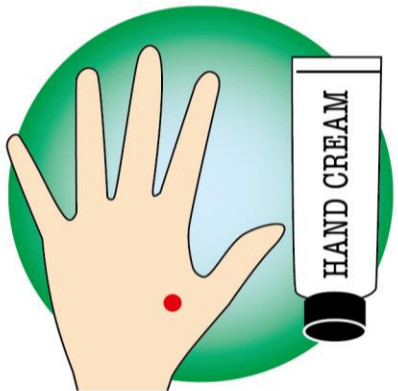
手の甲の親指と人差し指の骨が合流する側のくぼみが「合谷（ごうこく）」

リラックスしたいときはラベンダー、シャキッとしたときは柑橘系など、気分に合わせて違う香りのものを使い分けるのも良いですね。オイルマッサージもおすすめ。ハンドクリームと同じ感じで塗りながら、指一本一本を付け根から指先へ少し力を入れてすべらせながらマッサージしたり、ツボの「合谷（ごうこく）」を押すなどすれば、リフレッシュにもなります。