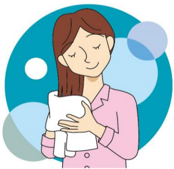
ヘアオイルや洗い流さないトリートメントは入浴後の髪の水分を優しく、しっかりとることで効果に違いが出ます！

洗い流さないトリートメントも良いですよ。タオルで水分をとった髪に適量をとり、毛先を手でつかみながらしっかりとなじませ、手に余ったものを手ぐしで髪全体につけます。べたつきの原因になるので、髪の生え際や頭皮にはつかないように気をつけましょう。 ちなみに、トリートメントとコンディショナーの違いってご存じですか？トリートメントは髪に栄養を与え、修復してくれるもの。コンディショナーは、髪の表面を保護してく