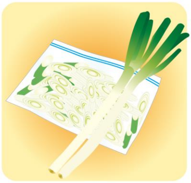
平たくして冷凍すると、冷凍効率が上がり、省スペースで保存できます

ぎも生のままの冷凍保存が可能！ちなみに、キャベツやレタスは、水分を多く含み、ごぼうなどは繊維が多いので、冷凍には不向きと言われています。トマトは、生食用でなく、加熱用として使うならOK。凍ったトマトを水でぬらすと、皮がおもしろいようにむけ、湯むきいらずで、料理に使えますよ！