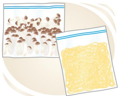
野菜やキノコ、パスタの保存期間は1カ月ほどだと言われていますが、様子を見てコンスタントに使うと良いですね

キノコは、冷凍することで細胞がこわれて酵素が働き、うまみ成分や栄養価もアップするそうです。