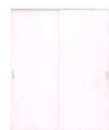
クローゼット引戸