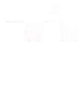
収納ユニット (プライベートルーム)