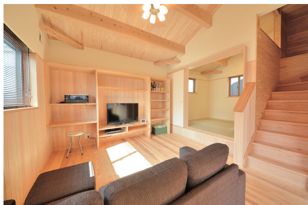
▲住まいる玄の施工例。写真はイメージで、見学会場とは異なります

K邸の特徴は、大容量の収納と、階段手すりの納まり。ぐるっと一周回遊できる動線もチェックポイントです。