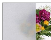
熱線遮断FRP かすみ型