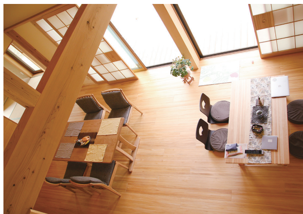
▲住まいる玄の施工例。写真はイメージで、見学会場とは異なります

「純日本風の家屋が好き」と話すイタリア人の奥様も納得の、自然素材＋外断熱工法の夏涼しく冬暖かい快適な造りを会場でぜひご体感ください。