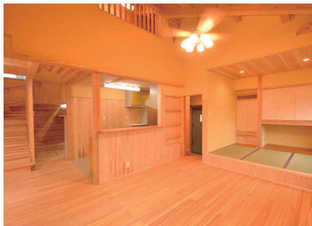
▲住まいる玄の施工例。写真はイメージで、見学会場とは異なります