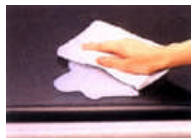
◎サッと一拭き お掃除ラクラク♪