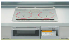
表面がフラットな電気クッキングヒーターなら毎日のお掃除も簡単

部屋全体の環境がクリーンに保てるということは部屋の壁紙の汚れなども少なくて済むということ。電化住宅は汚れにくい住宅なのです。