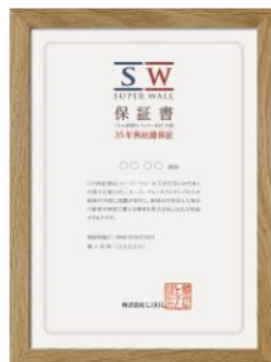
保証書（35年無結露保証）

※保証対象となる断熱材は、壁パネル、屋根パネル、小屋パネルに使用している硬質ウレタンフォームとなります。