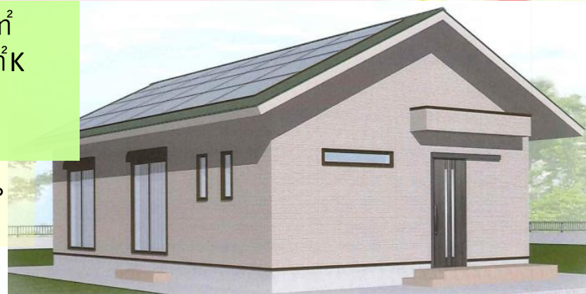
完成現場イメージ図

C値 0.26cm 2 /m 2 UA値 0.40W/m 2 K ηAC値 1.4 耐震等級 3