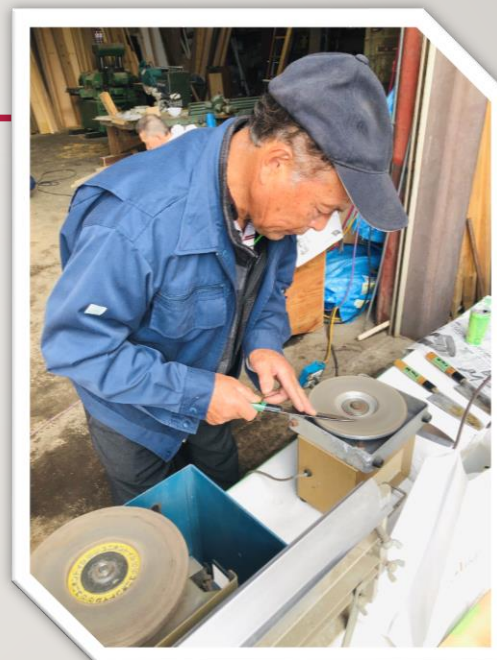
大工さんによる包丁研ぎ