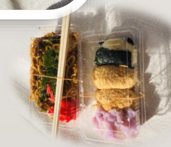
つきたてお餅 焼きそば

47組109名のお客様にお越し頂きました。 ご来場いただきましてありがとうございました。 ございました。