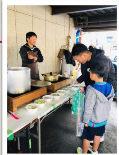
無料飲食コーナー 豚汁、焼きそば お餅、ドリンク