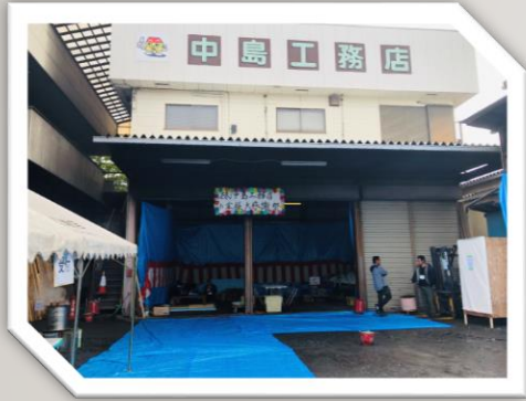
11/24 (日) お客様大感謝祭