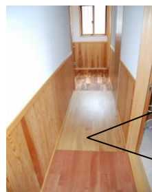
アカシア・クリ・サクラの3種類を使っています。