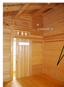
2階 西部屋 8帖