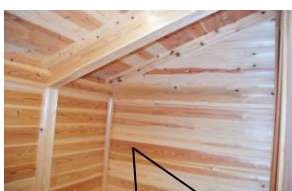
2階 西部屋 隣接納戸