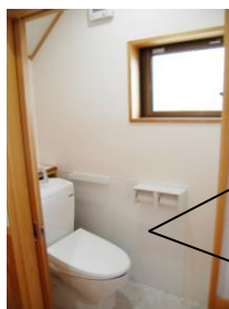
タカラ ホーロー イレパネル サニタリー フローア