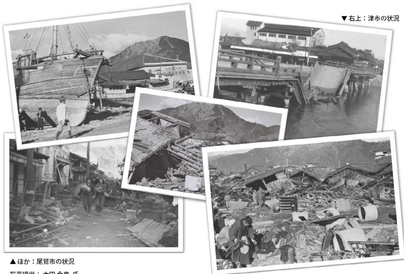
▲ほか：尾鷲市の状況