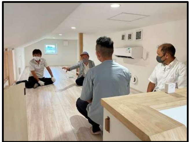
小屋裏のエアコンの仕組みの説明(プロ向け)