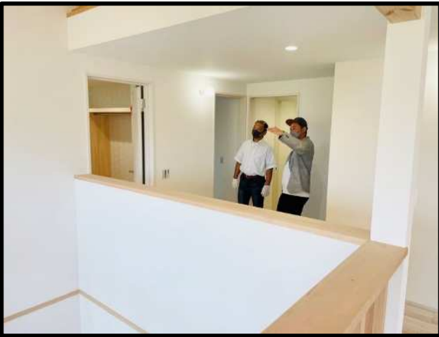
庇の距離と天井高さの説明