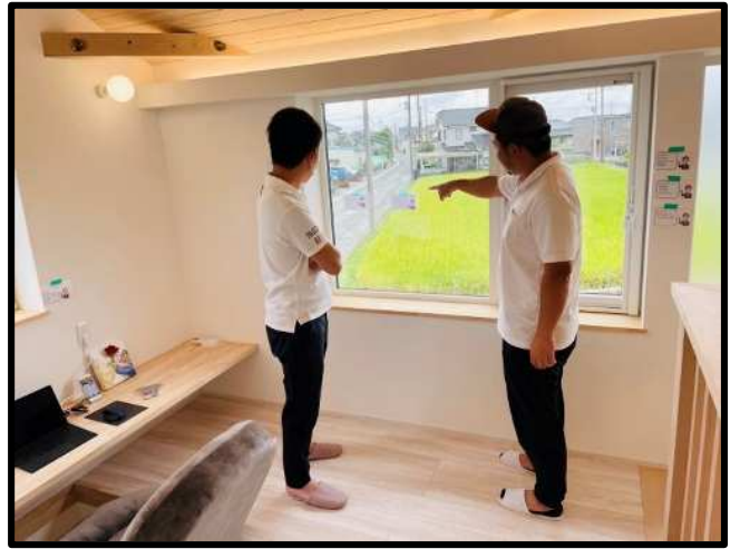
建物を道路と並行ではなく南に向けている説明