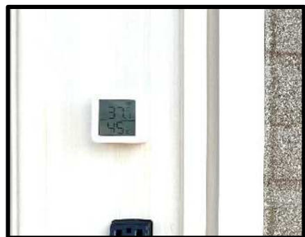
当日の屋外37°Cと屋内24°Cの温度 室内は絶対湿度12.8 g / m 3 で快適 エアコンの設定温度20°C