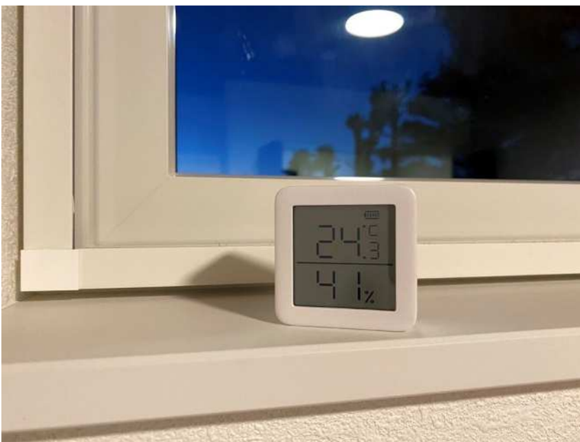
夕方の外気温8°C 窓に近くても室温24°C