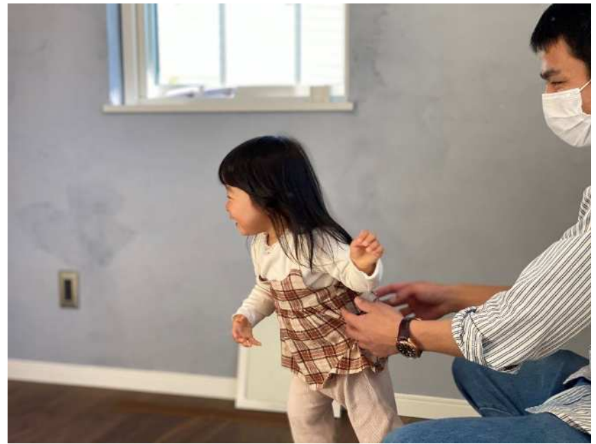
楽しくてはしゃぐ