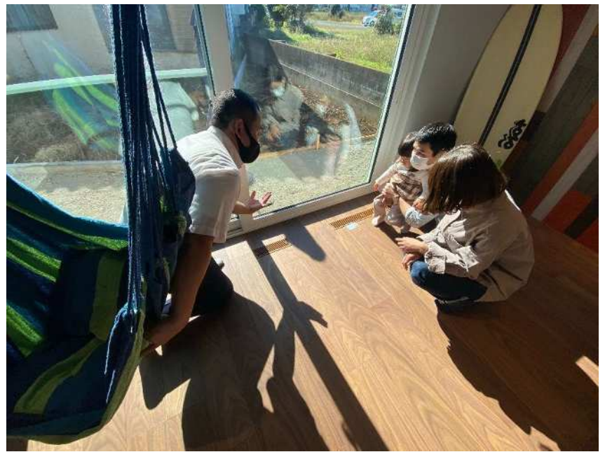
床下エアコンの説明風景