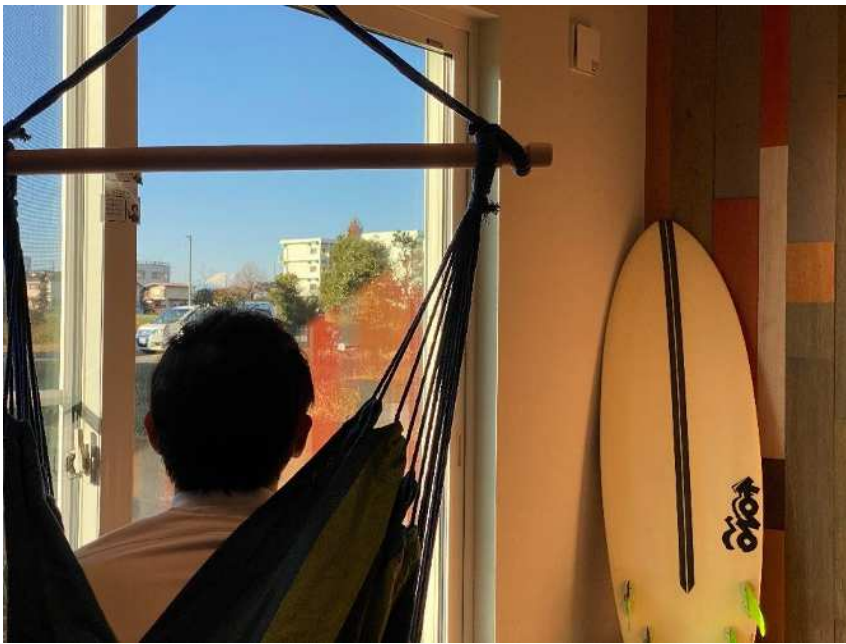
ハンモックから富士山を見る