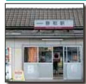
■静和駅 650m 徒歩 8分