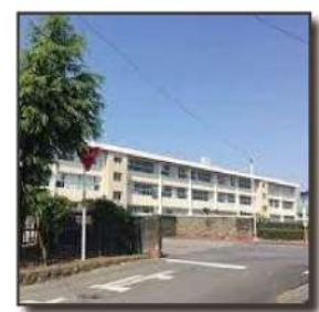
■岩舟中学校 1.9km 自転車 10分