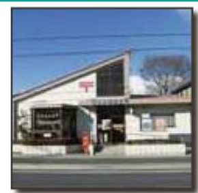
■静和郵便局 550m 徒歩 7分