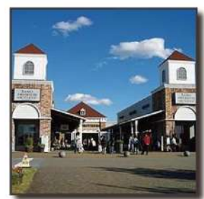
■佐野プレミアムアウトレット 8.8km 車 18分

＜物件概要＞ ◎所在地：栃木県栃木市岩舟町静和 2090-1 ◎交通：東武日光線【静和駅】 ◎総面積：3301.45㎡ ◎土地面積：2446.53㎡ ◎地目：現況畑（宅地予定） ◎建ぺい率：60% ◎用途地域：第一種住居地域 ◎容積率：200% ◎区画数：8区画 ◎道路幅員：6m ◎設備：公共下水・市水道 ◎水道工事負担金 600,000円 / 区画 ◎取引態様：売主 ◎土地価格：650万円～780万円 ◎下水道受益者負担金：330円 / ㎡ ◎所属団体名：栃木県宅地建物取引業協会