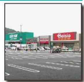
■カインズモール 5.0km 車 11分