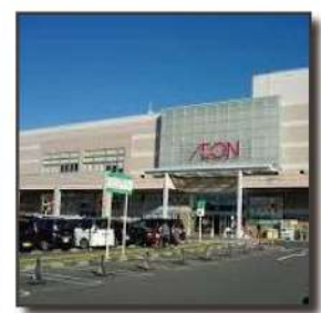
■佐野イオンモール 8.8km 車 18分