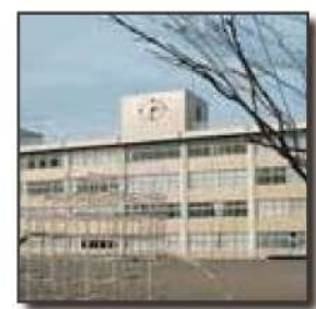
■静和小学校 650m 徒歩 8分