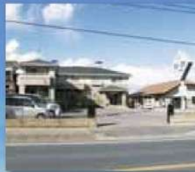
長谷川医院 徒歩 4分 (内科・循環器科)

国道50号からすぐの 快適なロケーション。 求めていた生活が 実現できる分譲地です。 カインズモール ……………車で約10分 カワチ ……車で約10分