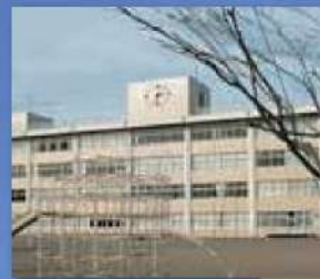
静和小 徒歩 6分