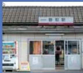
東武静和駅 徒歩 7分