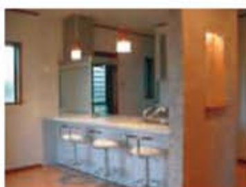
お洒落なカウンターの家