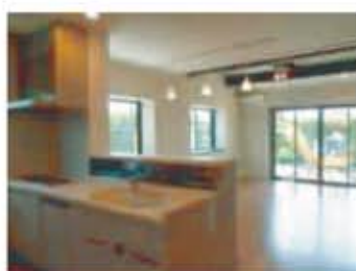
家族が集うリビングのある家